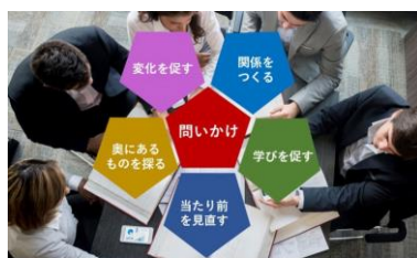
ゼミ「問いかけ力を磨こう」

このゼミでは6つの視点から対話と演習、実践体験を通して自分の問題意識を多面的に磨くことで、質の高い課題解決につながる問いかける力と場づくり力を身につけます。