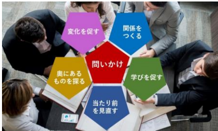
ゼミ「問いかけ力を磨こう」

このゼミでは6つの視点から対話と演習、実践体験を通して自分の問題意識を多面的に磨くことで、質の高い課題解決につながる問いかける力と場づくり力を身につけます。